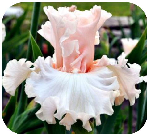
MAGICAL (ТВ) Ghio

Фото 1 до статті: Аматорська гібридизація Нотатки з гібридизації (Б. Блайза)