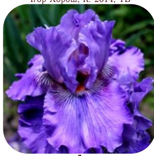
ПРИВАТНИЙ ДЕТЕКТИВ (PRYVATNY DATAKTYV)