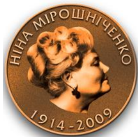
Ескіз пам'ятної медалі УСІ імені Ніни Мірошніченко