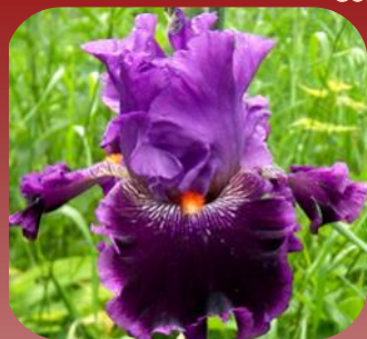
НЕ ЗГАСИ ВОГОНЬ (NE ZHASY VOHON), TB 2014