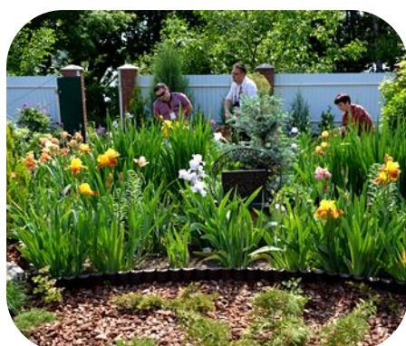
Неперевершений сад ірисів Алли Черногуз