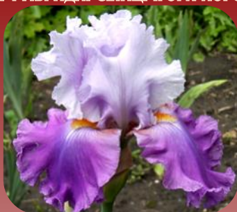
ТВ ІХ-102705 (WINSOME DANCER × KALIGAZAM)