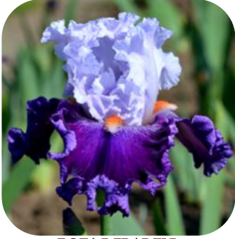
БЕЛАЯ ГВАРДИЯ (BELAJA GVARDIJA), TB 2015