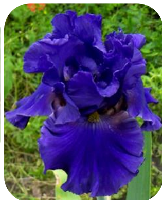
В ПОЛОНІ СІНІХ ВЕЧОРІВ (V POLONI SYNİKH VECHORIV)