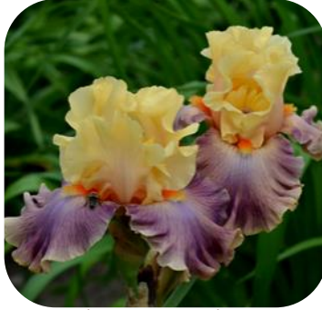
НАРОДНІЄ СКАЗКИ (NARODNYJE SKAZKI), TB 2015