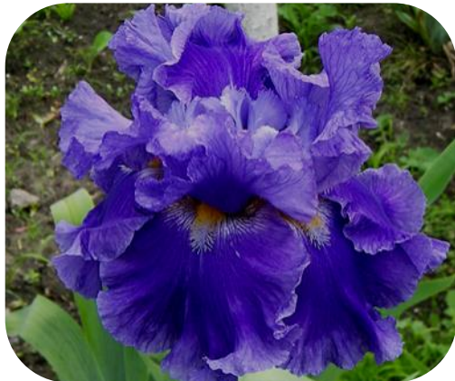
Сіянець ТВ І.Хороша