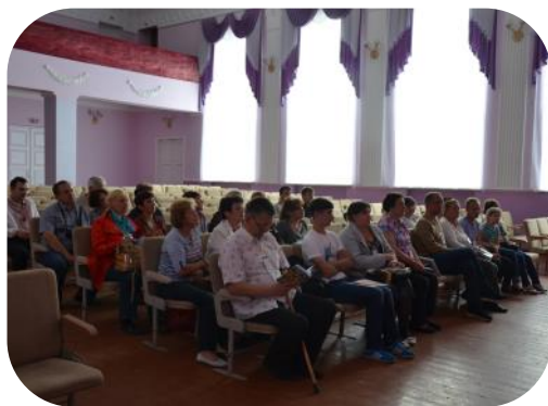
Чергові збори членів УСІ в рамках IV з'їзду на Полтавщині