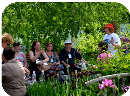
Після плідної роботи можна і перепочити в затишному куточку саду