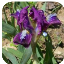
Фото до статті: Шкідники ірисів: ірисова муха ( Acklandia servadeii ) і оленка волохата ( Epicometi hirta )