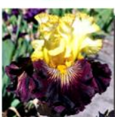
RECKLESS ABANDON X