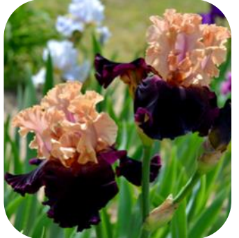
КАРПАТСЬКИЙ ГОРЄЦЬ (KARPATSKYI HORETS), TB 2015