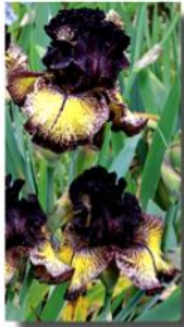
PETTICOAT SHUFFLE X