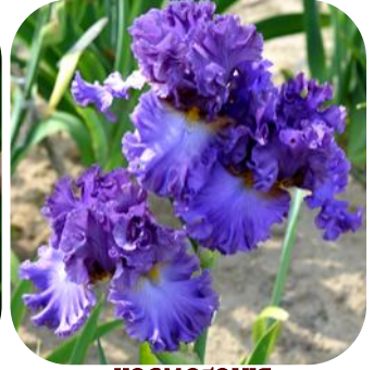
КОСМОГОНІЯ (KOSMOGONIIA), TB 2015