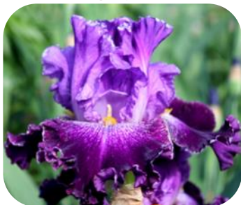
ЗИМОВА ВИШНЯ (ZYMOVA VYSHNIA)