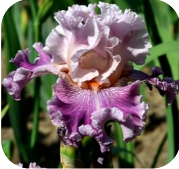
РЕНЕСАНСНОЄ НАСТРОЄНІЄ (RENESSANSNOIE NASTROIENIIE), TB 2015