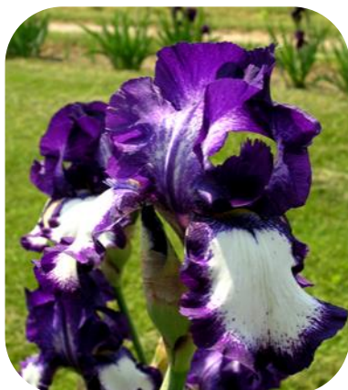
STEPPING OUT (TB) Schreiner

Фото до статті: Варіабельність забарвлення оцвітини Iris pumila L. у природних популяціях Миколаївської області (Т. Троїцької)