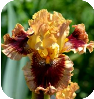
ПІРАТСЬКІЄ СТРАСТИ (PIRATSKIE STRASTI), TB 2015