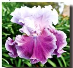
AVENUE OF DREAMS X

AVENUE OF DREAMS X MY BELOVED (X103) - знову ж "нервові пальці" і рекомендація виробника MY BELOVED (Джо Го) - як супер батька, особливо для м'яких пастельних тонів. У мене, звичайно, є деякі прекрасні пастелі, хоча я сумніваюся, що вони є кращими в порівнянні з далазоні м'яких пастельних ірисів. Це буде дуже цікаво - поспостерігати їх ще пару років. Ще одним негативним фактором тут для мене є дуже пізнє цвітіння гібридів, середина листопада, а ми звичайно віддаємо перевагу раннім і середнім сортам, тому що квітки пізніх сортів іноді можуть "згоріти" на початку раннього літа.