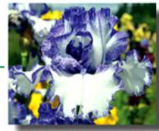
INK PATTERNS (parent of 09-93A)