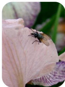
Ірисова муха ( Acklandia servadeii )