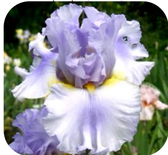
UKRAINIAN JOY (УКРЕЙНІЕН ДЖОЙ)