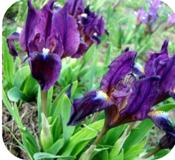
LITTLE SUPERSTITION (ЛІТЛ СІЈУПЕСТІШН), MDB, 2012