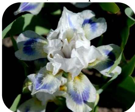
BLUE POOL'S (SDB)

Фото до статті: Махровість квіток ірису (Джин Уітт)