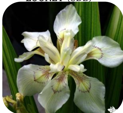
I. pseudacorus var. alba