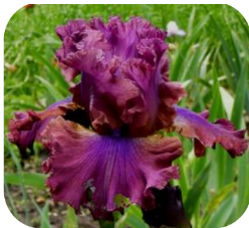
UKRAINIAN EVENING (УКРЕЙНІЕН ІВНІНГ)