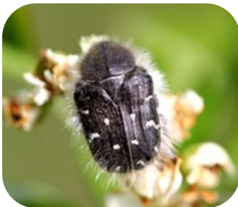
Оленка волохата ( Epicometi hirta )

Фото до статті: Шкідники ірисів: ірисова муха ( Acklandia servadeii ) і оленка волохата ( Epicometi hirta ) (О. Трякіної)