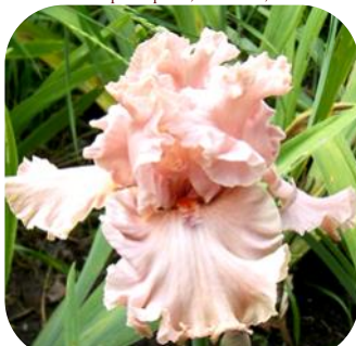
UKRAINIAN DREAM (УКРЕЙНІЕН ДРІМ)