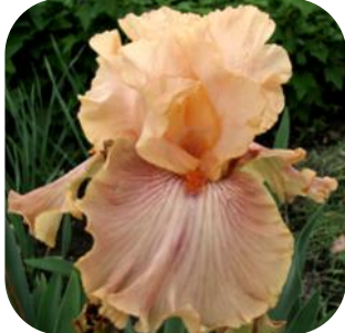
ГЕРОЯМ НЕБЕСНОЇ СОТНІ (HEROIAM NEBESNOYI SOTNI) TB, R, 2015