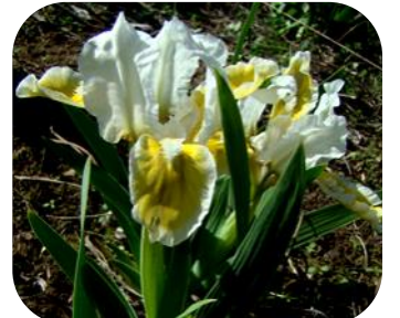
ПАПОРОТІ ЦВІТ (PAPOROTI TSVIT), MDB, 2012