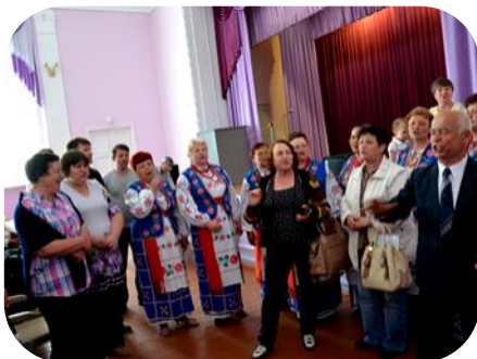
Гості можуть не тільки споглядати, а і файно заспівати...

Фото до статті: Про з'їзд УСІ на Полтавщині очима господаря саду (А. Черногуз)