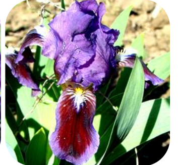
БУРХЛИВЕ МОРЕ (BURKHLIVE MORE), MDB, 2012