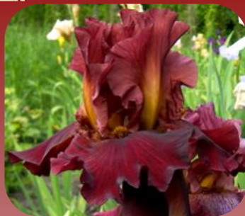
ТВ ІХ-100101 (GLAMAZON × DYNAMITE)