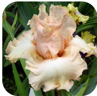
MISS UKRAINE (МИСС УКРЕЙН)