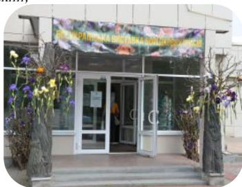
Ірисове оформлення входу на виставку